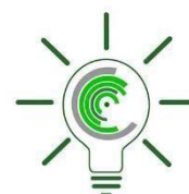
Innowacyjne pomysły młodych naukowców: Nauka - Start'up - Przemysł

Tak szeroki zakres tematyczny pozwoli wspierać interdyscyplinarność i wymianę wiedzy oraz doświadczeń z różnych obszarów badawczych. W wielu dokumentach unijnych i krajowych podkreśla się konieczność tworzenia gospodarki bazującej na wiedzy poprzez zwiększanie potencjału naukowego, mobilności kadr naukowych oraz komercjalizacji wynalazków i innowacji. Dlatego też celem konferencji jest promocja rozwiązań innowacyjnych, tworzonych w znacznym stopniu przez młodych pracowników nauki, doktorantów i studentów. Organizatorzy mają nadzieję, iż prezentacja innowacyjnych rozwiązań i ich promocja wśród partnerów IATI i przedstawicieli przemysłu pozwoli na szybsze wdrożenie niektórych z nich.